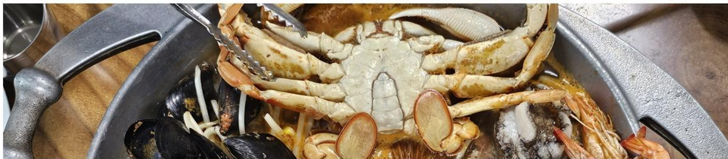
【濟州獨特風味美食】澎湃海鮮鍋(大章魚+貝類+鮑魚)