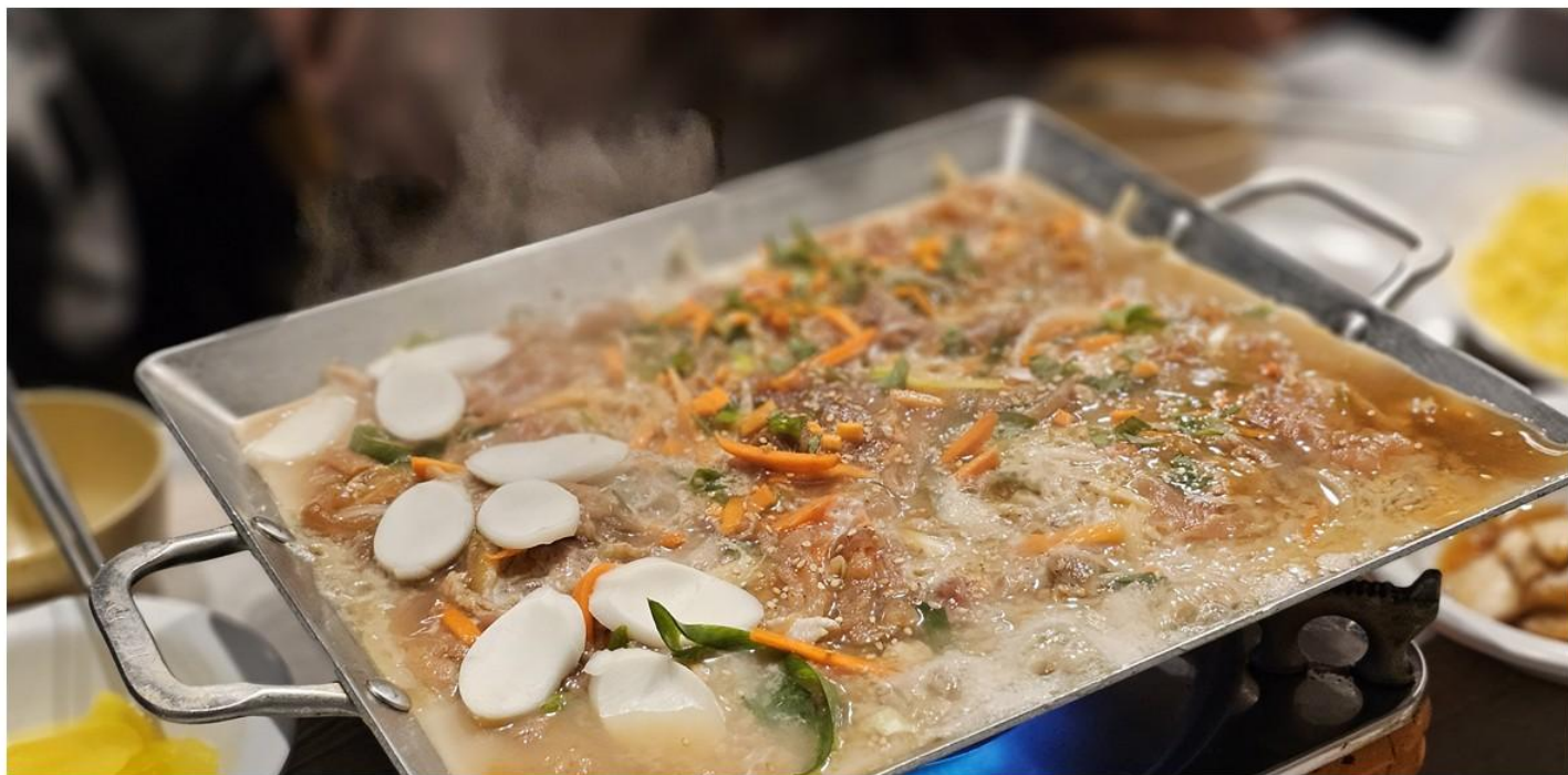
【濟州獨特風味美食】濟州黑毛豬壽喜燒+漢拿山炒飯+季節小菜