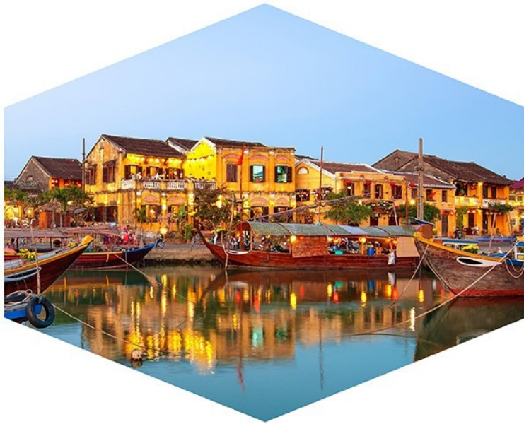
World Heritage in Vietnam