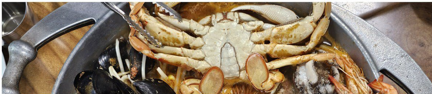
【濟州獨特風味美食】澎湃海鮮鍋(大章魚+貝類+鮑魚)