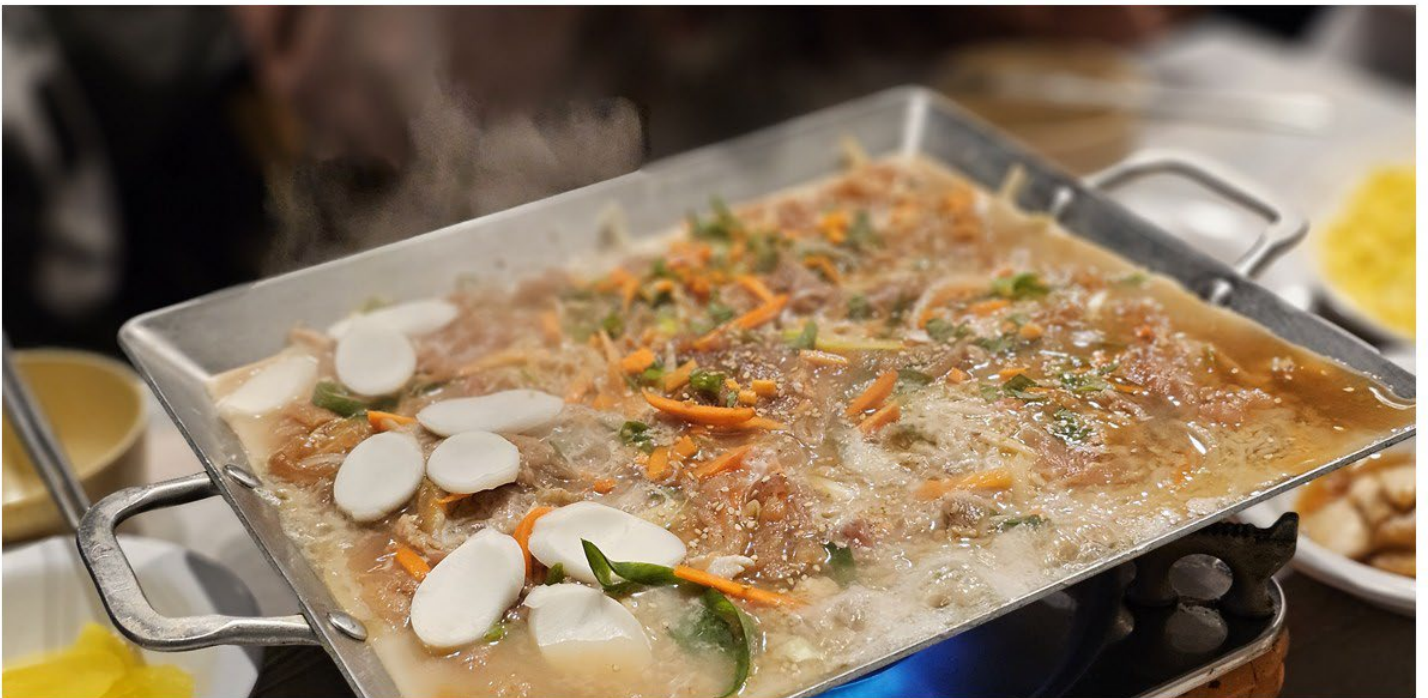
【濟州獨特風味美食】濟州黑毛豬壽喜燒+漢拿山炒飯+季節小菜