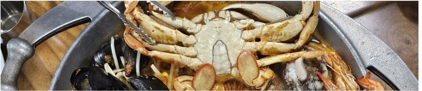
【濟州獨特風味美食】澎湃海鮮鍋(大章魚+貝類+鮑魚)